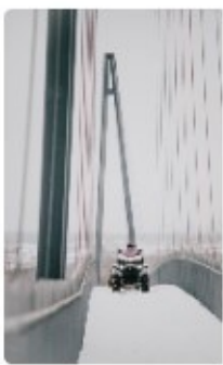
La rivière Chaudière2